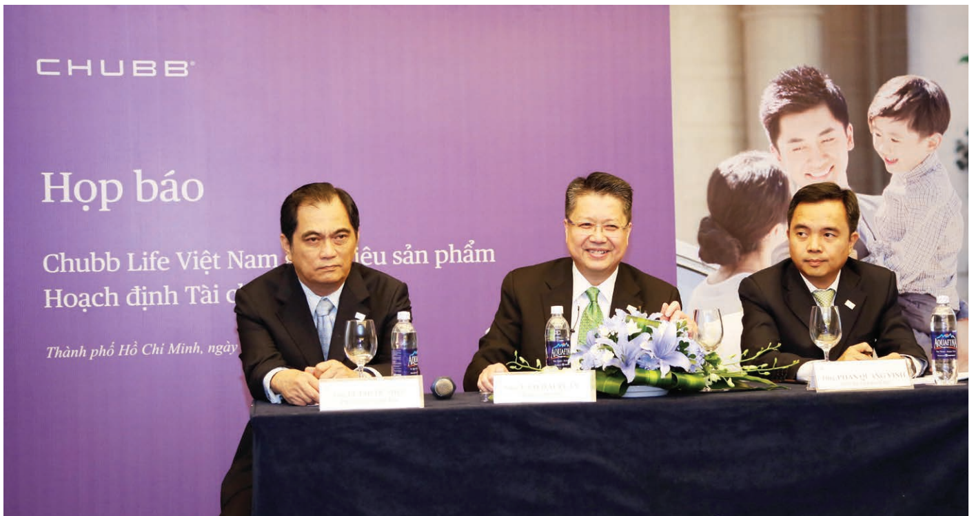
Đại diện Chubb Life trả lời thắc mắc của báo giới.

Chubb Life Việt Nam vừa chính thức giới thiệu dòng sản phẩm “Hoạch định Tài chính Tương lai” với hai sự lựa chọn dành cho khách hàng gồm “Định hướng Bền vững” và “Định hướng Gia tăng”. Là phiên bản tối ưu của nhóm sản phẩm Bảo hiểm Liên kết chung (Universal Life), các quyền lợi của “Hoạch định Tài chính Tương lai” được xem là giải pháp ưu việt hàng đầu cho những khách hàng mong muốn duy trì mục tiêu đầu tư và tích lũy tối đa cho giá trị tài khoản bảo hiểm của mình, bên cạnh việc bảo vệ toàn diện cho bản thân và gia đình thân yêu.